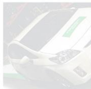
Presque 130 m pour la Prius, + 64 % grâce au pneu « proto » de Nokian.

☛ CGS-Continental. CGS s'élève au niveau sonore des roues motrices. Sous la marque Conti produit aussi des RM sous Cultor, Mitas et Euzkadi) il y a le tir de SilentSpeedTyre. Au répond à un besoin du marché où l'on peut rouler sur route. A cette allure le niveau sonore gêne les conducteurs d'où ce pneu réduisant les vibrations perçues dans la cabine de 3 à une diminution de plus Homologué pour 70 km/h, différence esthétique avec conventionnels, ce SST n'est pas un produit qu'en 2 dimensions, 650/65R et 600/65R.